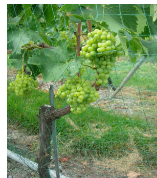
Photo Variété Exalta Châteauneuf août 2011