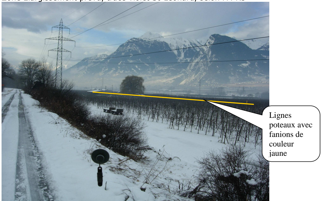
Ardon, les Iles d'Ardon, Bey à l'Ane, élargissement prévu, projet officiel PAR3